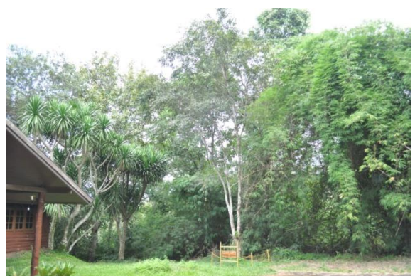
ภาพที่ ๑๐ ภูมิทัศน์รอบบริเวณต้น