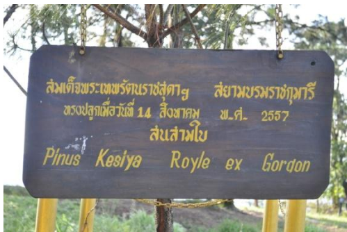
ภาพที่ ๒๕ ป้ายชื่อผู้ทรงปลูกและชื่อต้นไม้

๓.๖ สมเด็จพระเทพรัตนราชสุดาฯ สยามบรมราชกุมารี ทรงปลูกต้นสนสามใบ (ยอดภูเรือ) จำนวน ๑ ต้น เมื่อวันที่ ๑๔ สิงหาคม ๒๕๕๗