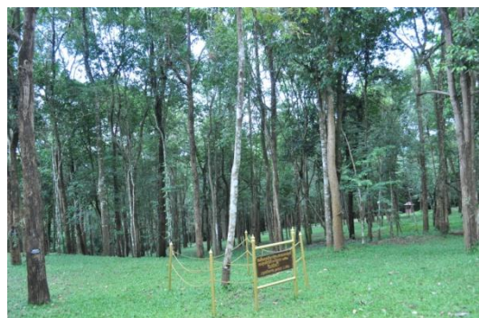
ภาพที่ ๑๕ ลำต้น