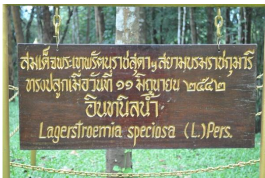
ภาพที่ ๑๔ ป้ายชื่อผู้ทรงปลูกและชื่อต้นไม้

๓.๓ สมเด็จพระเทพรัตนราชสุดาฯ สยามบรมราชกุมารี ทรงปลูกต้นอินทนิลน้ำ (ข้างเรือนรับรองที่ประทับภูเรือ) จำนวน ๑ ต้น เมื่อวันที่ ๑๑ มิถุนายน ๒๕๔๑