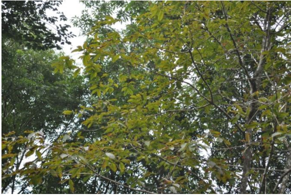
ภาพที่ ๑๖ ใบ