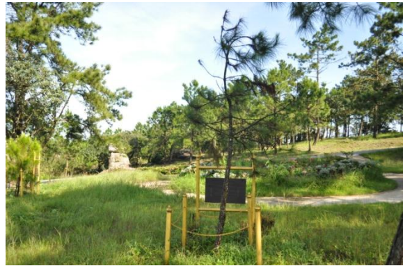
ภาพที่ ๒๔ ภูมิทัศน์รอบบริเวณต้นสนสามใบ

หมายเหตุ ต้นสนสามใบไม่เจริญเติบโตเท่าที่ควร เนื่องจากปลูกอยู่ในตำแหน่งพื้นที่ลุ่ม ในฤดูฝนน้ำจะไหลมาท่วมรากทำให้รากเน่า จึงได้แนะนำให้เจ้าหน้าที่อุทยานแห่งชาติภูเรือขุดร่องน้ำให้น้ำเปลี่ยนทางเดิน