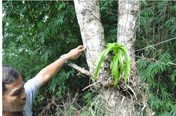
ภาพที่ ๑๒ ปลวกกัดกินโคนและลำต้น