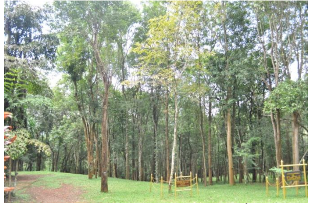
ภาพที่ ๑๗ ภูมิทัศน์รอบต้นอินทนิลน้ำ

๓.๔ พระเจ้าหลานเธอ พระองค์เจ้าพัชรกิติยาภา ทรงปลูกต้นพะยูน (ข้างเรือนรับรองที่ประทับภูเรือ) จำนวน ๑ ต้น เมื่อวันที่ ๑๑ มกราคม ๒๕๕๘