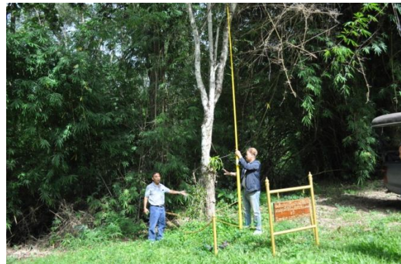
ภาพที่ ๘ ลำต้น