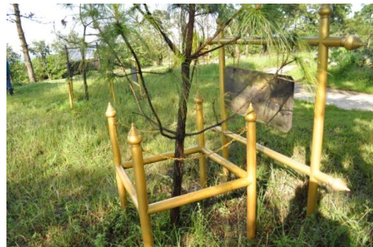
ภาพที่ ๒๖ ลำต้น