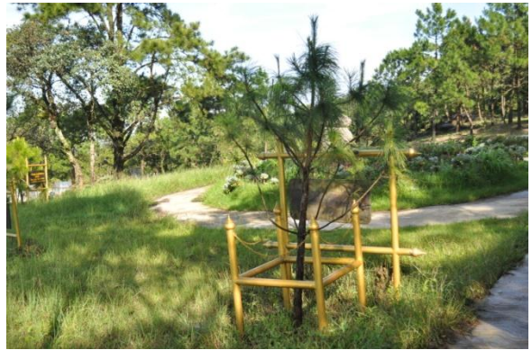
ภาพที่ ๒๗ ใบ