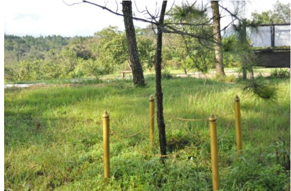
ภาพที่ ๒๒ ลำต้น