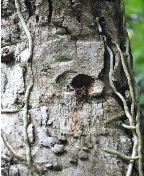
ภาพที่ ๑๑ ตั้วงหมวดยาวเจาะรูวางไข่