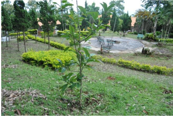
ภาพที่ ๓ ลำต้นมณฑาดอย

สมเด็จพระเทพรัตนราชสุดาฯ สยามบรมราชกุมารี ทรงปลูกต้นมณฑาดอย เมื่อวันที่ ๕ พฤศจิกายน ๒๕๕๑ บริเวณบ้านโชนที่ ๒ ต้นไม้ปลูกในพื้นที่ลุ่มน้ำท่วมรากเน่า ปลวกกัดกินรากและลำต้น ยืนต้นตาย เจ้าหน้าที่อุทยานแห่งชาติได้นำต้นใหม่มาปลูกทดแทนแล้ว