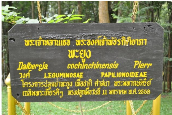
ภาพที่ ๑๘ ป้ายชื่อผู้ทรงปลูกและชื่อต้นไม้

๓.๔ พระเจ้าหลานเธอ พระองค์เจ้าพัชรกิติยาภา ทรงปลูกต้นพะยูน (ข้างเรือนรับรองที่ประทับภูเรือ) จำนวน ๑ ต้น เมื่อวันที่ ๑๑ มกราคม ๒๕๕๘