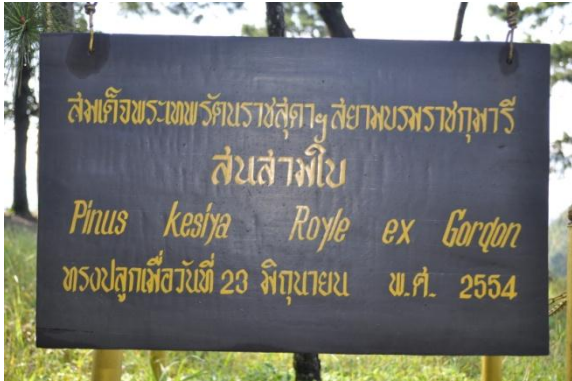
ภาพที่ ๒๑ ป้ายชื่อผู้ทรงปลูกและชื่อต้นไม้

๓.๕ สมเด็จพระเทพรัตนราชสุดาฯ สยามบรมราชกุมารี ทรงปลูกต้นสนสามใบ (ยอดภูเรือ) จำนวน ๑ ต้น เมื่อวันที่ ๒๓ มิถุนายน ๒๕๕๔