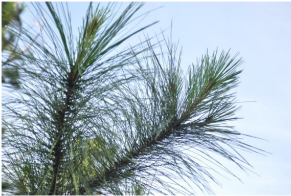
ภาพที่ ๒๓ ใบ