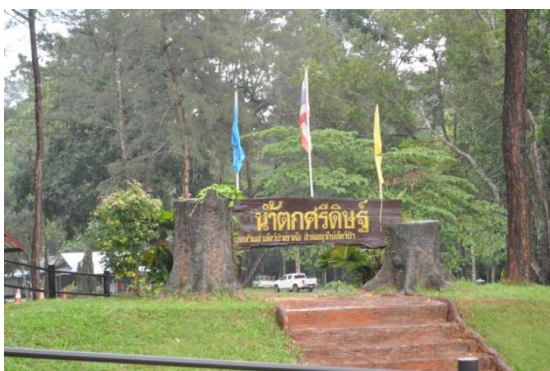
ภาพที่ ๑ ป้ายชื่อน้ำตกศรีดิษฐ์