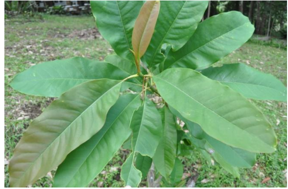
ภาพที่ ๔ ใบ