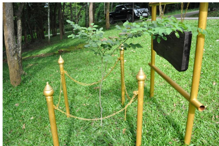
ภาพที่ ๒๐ ลำต้นและภูมิทัศน์รอบบริเวณต้นพะยูน