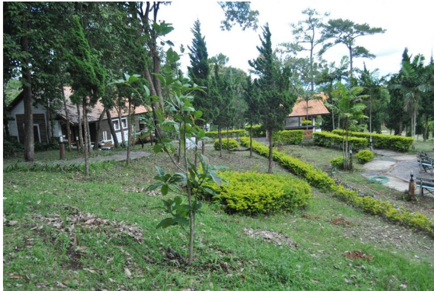
ภาพที่ ๕ ภูมิทัศน์บริเวณรอบต้นมณฑาดอย