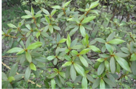
ภาพที่ ๑๑ ใบ