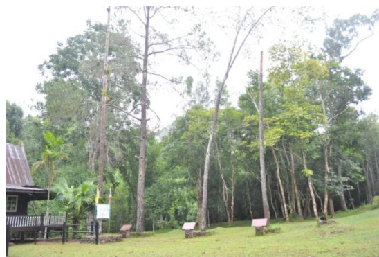
ภาพที่ ๒ ต้นสนสองใบทรงปลูก จำนวน ๓ ต้น

หมายเหตุ ต้นสนสองใบต้นไม้ทรงปลูก จำนวน ๓ ต้น เจ้าหน้าที่เขตรักษาพันธุ์สัตว์ป่าเขาค้อยังไม่ได้ดำเนินการจัดทำป้ายชื่อผู้ทรงปลูก ชื่อต้นไม้ และเสารอบต้นไม้ ปรับตั้งตรงต้นเอนและเปลี่ยนต้นไม้ยืนตายออก ตามที่เจ้าหน้าที่ฝ่ายปฏิบัติการอารักขาพันธุ์ไม้ป่าแนะนำ เมื่อระหว่างวันที่ ๙-๑๕ พฤษภาคม ๒๕๕๘