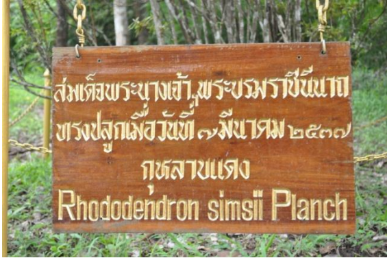
ภาพที่ ๑๐ ป้ายชื่อผู้ทรงปลูกและชื่อต้นไม้

๓.๒ สมเด็จพระนางเจ้าฯ พระบรมราชินีนาถ ทรงปลูกต้นกุหลาบแดง (บ้านราชวटी) จำนวน ๑ ต้น เมื่อวันที่ ๗ มีนาคม ๒๕๓๗