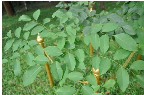
ภาพที่ ๑๙ ใบ