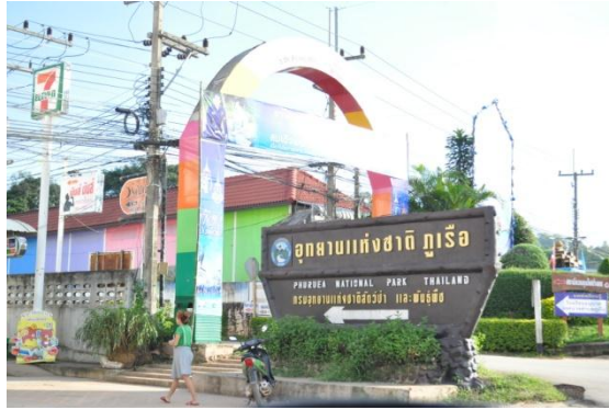
ภาพที่ ๖ ป้ายอุทยานแห่งชาติภูเรือ

๓. อุทยานแห่งชาติภูเรือ อำเภอภูเรือ จังหวัดเลย มีต้นไม้ทรงปลูก จำนวน ๗ ต้น