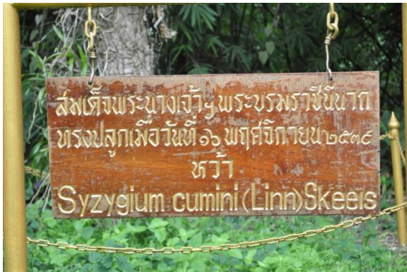
ภาพที่ ๗ ป้ายชื่อผู้ทรงปลูกและชื่อต้นไม้

๓.๑ สมเด็จพระนางเจ้าฯ พระบรมราชินีนาถ ทรงปลูกต้นหว้า (บ้านราชาวดี) จำนวน ๑ ต้น เมื่อวันที่ ๑๖ พฤศจิกายน ๒๕๓๙